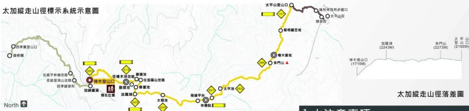
太加縱走山徑落差圖