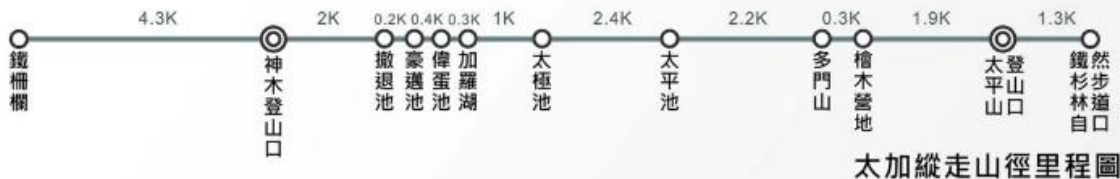
太加縱走山徑里程圖